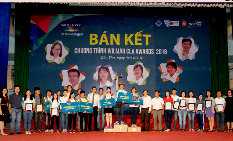
Trao giải cho các thí sinh.

Hy vọng rằng, thông qua cuộc thi các bạn sinh viên có thể tìm thấy hướng đi, công việc và niềm say mê của mình, góp sức trẻ xây dựng quê hương ngày một đẹp giàu.