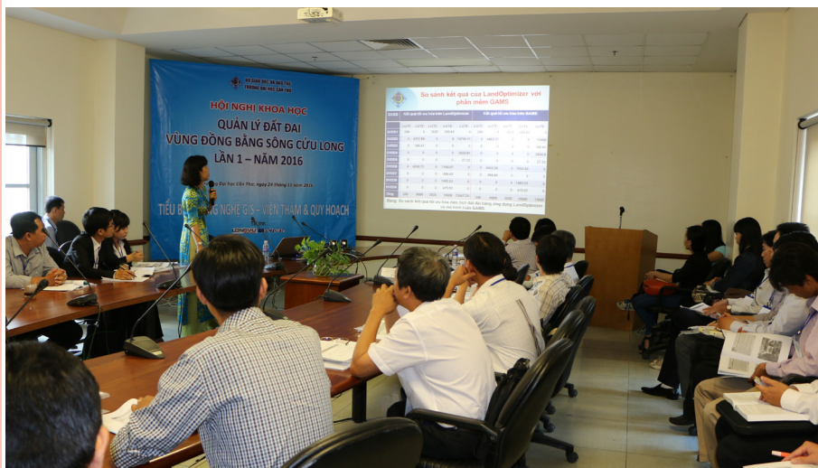
Đại biểu trình bày tham luận tại Tiểu ban.

Từ những góc độ khác nhau của các nhà khoa học, nhà quản lý, Hội nghị sẽ tìm ra giải pháp hữu hiệu, đồng thời đề xuất, thiết lập cơ chế và phương thức phù hợp với những yêu cầu, điều kiện của vùng ĐBSCL trong công tác giảng dạy, đào tạo và nghiên cứu khoa học, góp phần nâng cao hiệu quả trong phát triển ngành Quản lý đất đai của vùng.