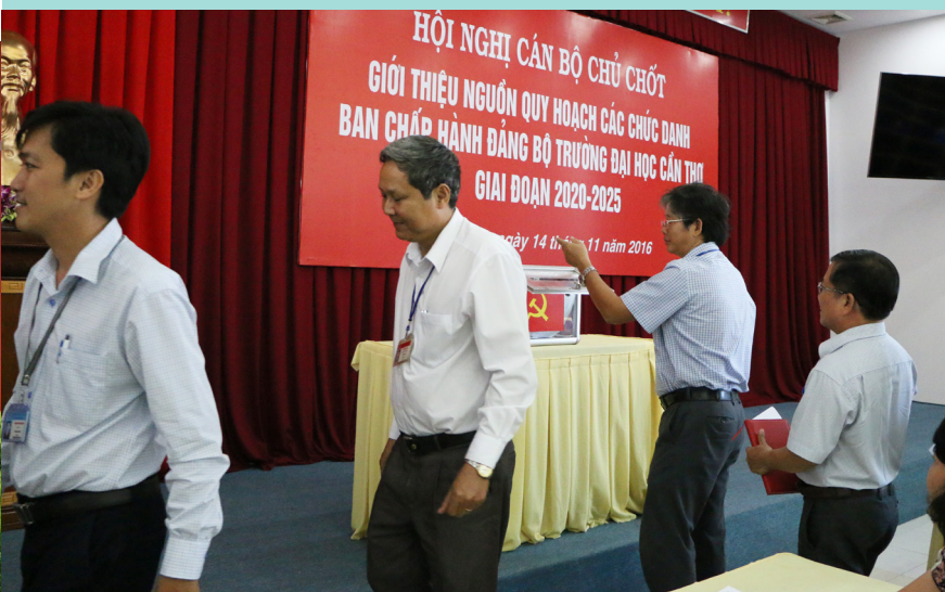
Đại biểu bỏ phiếu tại Hội nghị.

chức danh trong Đảng ủy Trường giai đoạn 2020-2025. Công tác quy hoạch nhằm sớm tìm ra và xây dựng nguồn cán bộ trẻ có đức, tài và khả năng lãnh đạo, quản lý để có kế hoạch đào tạo, bồi dưỡng, tạo nguồn các chức danh trong cấp ủy đảng. Sau khi nghe hướng dẫn lấy phiếu giới thiệu quy hoạch, các đồng chí cán bộ chủ chốt tham dự Hội nghị đã tiến hành bỏ phiếu giới thiệu nguồn nhân sự cho các chức danh trong Ban Chấp hành Đảng bộ, Ban Thường vụ, Bí thư, Phó Bí thư Đảng ủy giai đoạn 2020-2025 của Đảng bộ Trường ĐHCT.