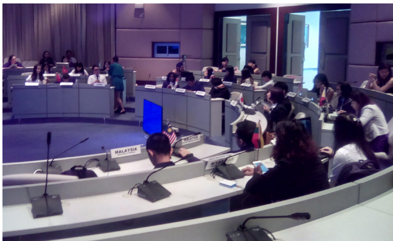
Diễn đàn giáo dục.

Tại Diễn đàn giáo dục, các đoàn đại biểu từ 11 quốc gia đã trao đổi về tình hình các nước và tình hình chung của khối xung quanh ba trụ cột