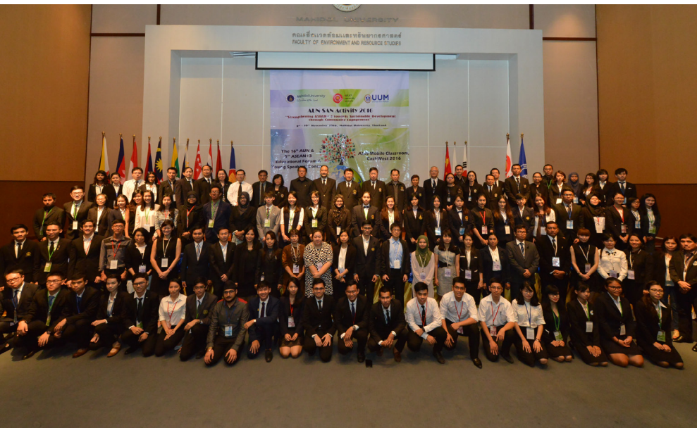
Các đại biểu chụp ảnh lưu niệm.

Bên cạnh diễn đàn giáo dục và cuộc thi hùng biện, Ban tổ chức đã giới thiệu hoạt động lớp học lưu động cho 16 sinh viên với các buổi học tập, giao lưu văn hóa. Thông qua các hoạt động trên, bên cạnh việc trau dồi kiến thức thì hầu hết các bạn sinh viên đã bày tỏ niềm vui khi được trải nghiệm văn hóa Thái Lan, được mở rộng giao lưu và gặp gỡ được nhiều bạn mới, xóa dần khoảng cách giữa các quốc gia.