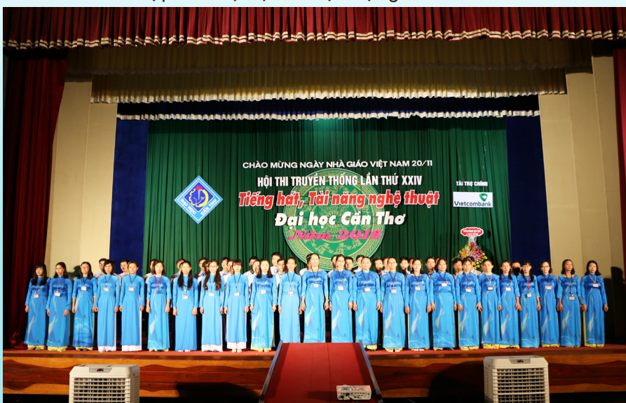
Tiết mục dự thi Hát tập thể Bài “Tiến quân ca” của cán bộ, viên chức.

Kết thúc Hội thi, Ban Tổ chức đã trao tổng cộng 76 giải thưởng cho tất cả các thể loại. Những giải thưởng được nhiều khán giả trông đợi nhất là phần thi hát tập thể bài “Tiến quân ca”, thi tài năng nghệ thuật cá nhân, múa hiện đại (nhóm nhảy), múa dân gian. Kết quả của phần thi hát tập thể bài “Tiến quân ca” dành cho cán bộ viên chức là: tập thể Khối Phòng ban đã xuất sắc đạt giải Nhất, tập thể Khoa Thủy sản đạt giải Nhì và tập thể Khoa Sư phạm kết hợp với Dự bị Dân tộc đạt giải Ba. Giải dành