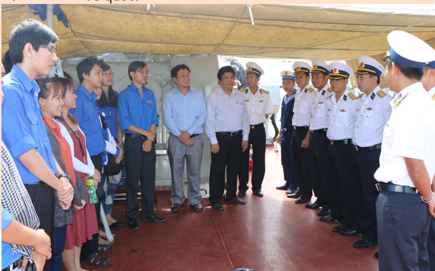
Nhân chuyến giao lưu với Bộ Tư lệnh Vùng 5 Hải quân, Cán bộ và sinh viên thăm hỏi các chiến sĩ trên tàu hải quân.

Vào tối ngày 30/10/2016, chương trình giao lưu văn nghệ với chủ đề “ Hát về biển đảo quê hương ” đã tạo cơ hội cho cán bộ sinh viên Trường ĐHCT tìm hiểu và tăng thêm tình đoàn kết, thắt chặt tình yêu thương giữa Nhà trường và cán bộ, chiến sĩ Bộ Tư lệnh Vùng Cảnh sát biển 4. Đây là khởi đầu cho mối quan hệ tốt đẹp trong tương lai bằng những hoạt động giao lưu, chuyển giao khoa học công nghệ cổ vũ các đồng chí về mặt tinh thần và điều kiện cơ sở vật chất đầy đủ hơn phục vụ nhiệm vụ cao cả bảo vệ biển đảo của Tổ quốc.