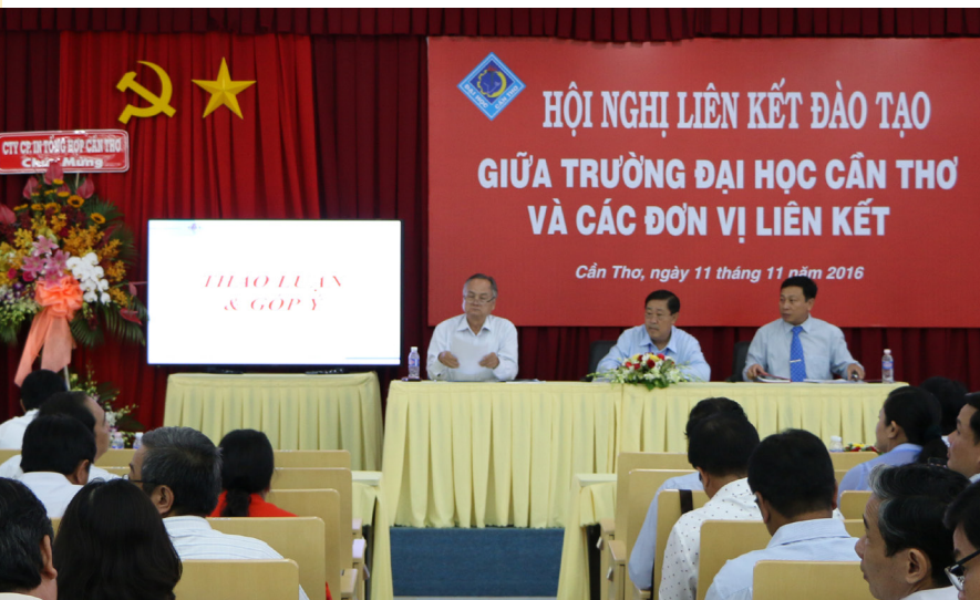
Toàn cảnh Hội nghị Liên kết Đào tạo giữa Trường ĐHCT và các đơn vị liên kết.

Ngày 11/11/2016, Trường Đại học Cần Thơ (ĐHCT) đã tổ chức Hội nghị Liên kết Đào tạo giữa Nhà trường và các đơn vị liên kết. Tham dự Hội nghị có đại diện lãnh đạo và chuyên trách các đơn vị đến từ các trường đại học, cao đẳng, trung cấp nghề, trung tâm giáo dục thường xuyên, trung tâm dạy nghề trong và ngoài khu vực Đồng bằng sông Cửu Long (ĐBSCL). Phía Trường ĐHCT có Đảng ủy, Ban Giám hiệu; đại diện lãnh đạo và chuyên trách các đơn vị trong Trường.