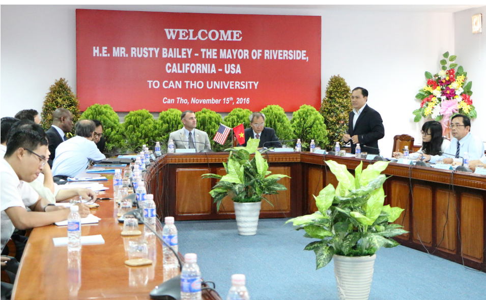
Tiếp Thị trưởng thành phố Riverside, California, Hoa Kỳ tại Nhà Điều hành, Trường ĐHTC.