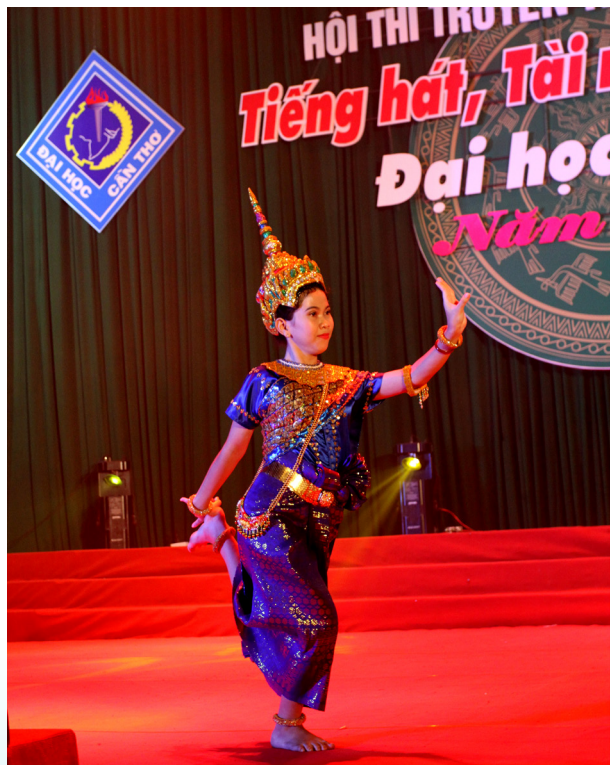
Tiết mục “Múa Cung đình” dự thi thể loại Tài năng nghệ thuật.

Tối ngày 16/11/2016, Chung kết xếp hạng và tổng kết, trao giải thưởng sau 10 ngày thi diễn, tranh tài sôi nổi của Hội thi “Tiếng hát, Tài năng nghệ thuật Đại học Cần Thơ”, lần thứ XXIV-năm 2016 nhằm Chào mừng kỷ niệm ngày Nhà giáo Việt Nam 20/11 đã diễn ra.