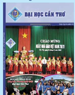
Ảnh bìa: Chào mừng Ngày 20-11

In 500 quyển, khổ 19 x 26cm, tại Công ty CP In Tổng hợp Cần Thơ tháng 12/2016.