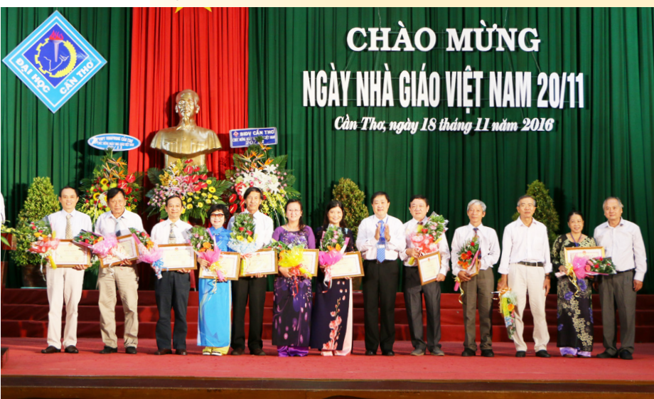
Trao bằng khen của Bộ trưởng Bộ Giáo dục và Đào tạo cho 15 cá nhân có nhiều đóng góp, xây dựng đơn vị, góp phần vào sự phát triển giáo dục.

Đào tạo công nhận Danh hiệu Chiến sĩ thi đua cấp Bộ cho 05 thầy, cô giáo, tặng Bằng khen cho 15 thầy, cô giáo, và tặng Kỷ niệm chương “Vì sự nghiệp giáo dục” cho 16 thầy, cô giáo. Nhân buổi lễ, Trường ĐHCT đã tôn vinh 28 thầy, cô giáo, viên chức, người lao động có nhiều đóng góp cho sự phát triển của Nhà trường. Đặc biệt, Nhà trường đã chia sẻ niềm vui và chúc mừng 12 Nhà giáo được Hội đồng Chức danh Giáo sư Nhà nước công nhận đạt chuẩn chức danh Giáo sư, Phó Giáo sư năm 2016.