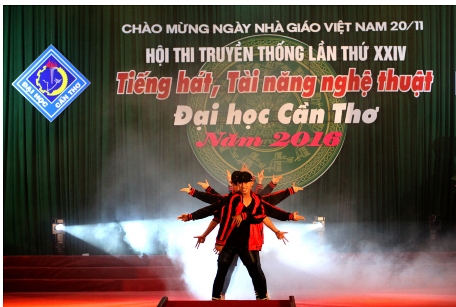
Một tiết mục dự thi thể loại múa Hiện đại – Nhóm nhảy.

Hội thi Tiếng hát Đại học Cần Thơ được tổ chức lần đầu tiên vào năm 1992 và trở thành Hội thi truyền thống của Trường, quy mô Hội thi tăng dần, từ những năm đầu chỉ có thể loại thi hát Quốc ca và đơn ca. Đến nay, trải qua 24